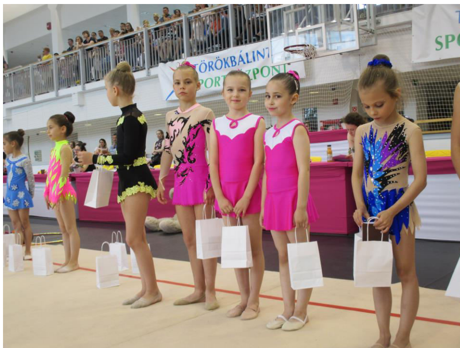
A felkészítők minden esetben Mészáros Judit és Mészáros Györgyné tanárnők voltak.